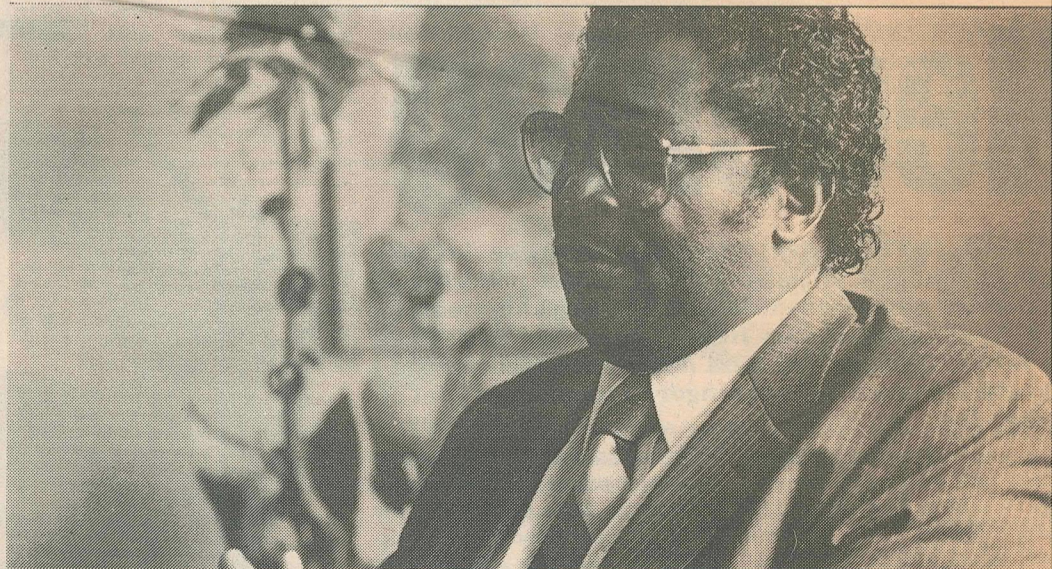
— Som bluesmusikar er eg ein stor fisk i ein liten dam, som musikar er eg ein liten fisk i ein stor dam, seier B. B. King.

folket sluttar opp om presidenten sin anten dei har stemt på han eller ikkje. Så Reagan er også min president, seier B.B. King, og har ikkje snev av ironisk glimt i augo. Spørsmålet om politisk engasjement byrjar å bli standard — til svarte musikarar. Som om dei skulle vere ein eigen politisk rase. Men Live Aid var noko av det største som har skjedd, seier B.B. King, som også har sunge blues i Sovjet. — Dei likte blues like godt der som her, seier han lakonisk. Han li-